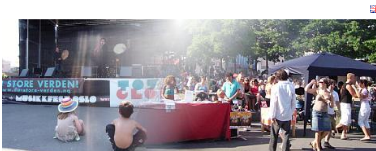
Fra Musikkfest Oslo 2008