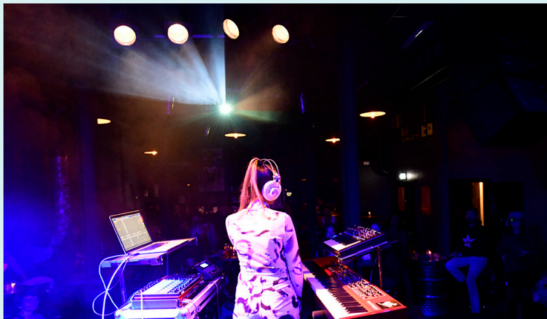
Min-T på Blå.