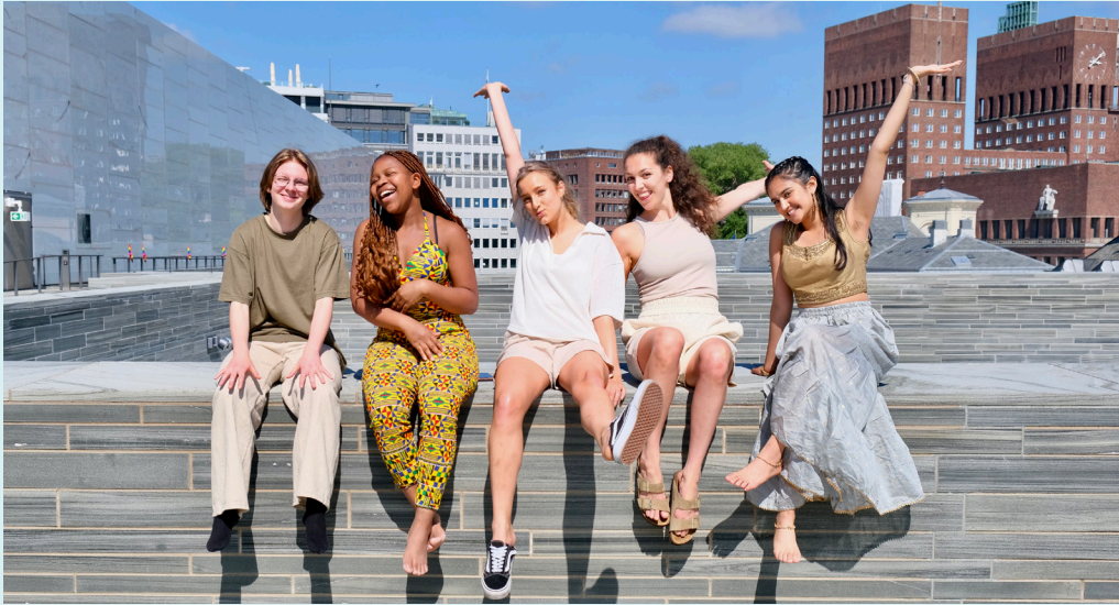
Dans-deg-inn hos Nasjonalmuseet.