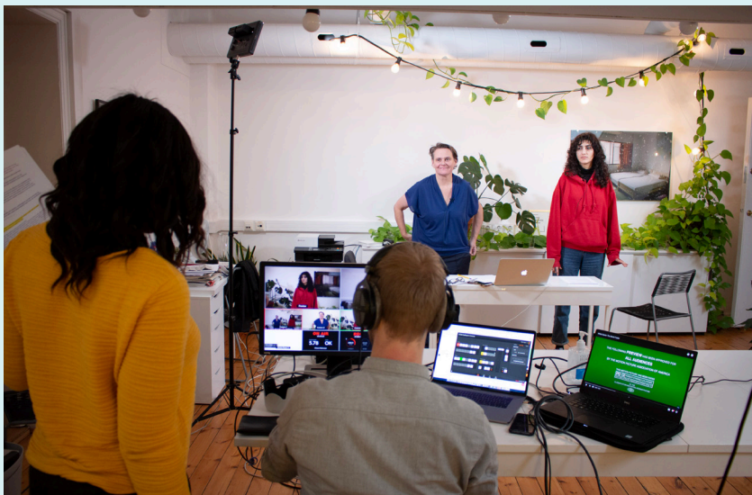
Workshop på InterkulturLAB, foto: Miriam Matsson, Nabunya AS.

Samarbeidspartnere: AKKS, JM Norway og Balansekunst.