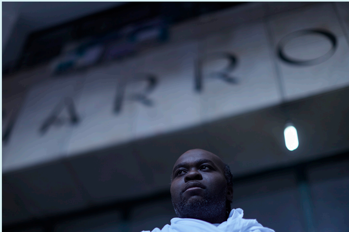
Foto fra filmen Cine Maroccos